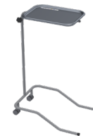
Mesa de curaciones Ref. 8125 Bandeja en acero inoxidable. Ruedas que permite movilizar la mesa en los ambientes hospitalarios. Capacidad de carga: 33lb

Facilidad e higiene. Diseño esencial para la atención de pacientes en procedimientos, consultorios y hospitalización.