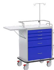
Carro de paro de lujo Ref. 8234 Superficie transparente para desfibrilador, barandilla de seguridad.