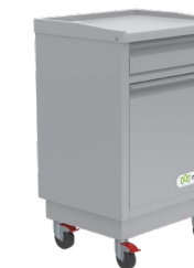
Mesa de noche de Lujo con frenos Ref. 841703