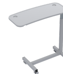
Mesa puente graduable Ref. 8461