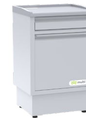
Mesa de noche de Lujo Ref. 841701