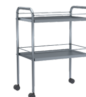
Mesa de curaciones Ref. 8290 Entrepaños para realizar preparaciones, transporte y clasificación de material. Capacidad de carga: 33lb