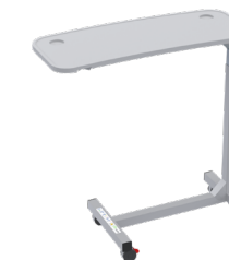
Mesa puente graduable con frenos Ref. 846101