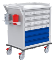
Nova estándar Unidosis ref. 824200 Gavetas con rótulo, almacenamiento médico y clasificación de residuos. Capacidad carga: 33lb.