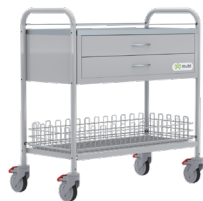
Carro medicamentos 2 Gavetas ref. 8230 Gavetas, y canastilla auxiliar. Capacidad de carga: 44lb.

Brindamos soluciones con diversos carros de medicamentos para transporte, dosificación y clasificación de medicamentos.