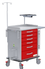
Carro de paro sencillo Ref. 813406 Carro hospitalario con tabla RCP, soporte de tanque de oxígeno y soporte cubeta de almacenamiento.