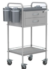
Transporte Medicamentos hg ref. 8193 Gavetas para medicamentos y soporte que permite ubicar guardián para transportar y almacenar material estéril. Capacidad carga: 66.1lb.